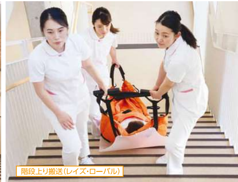
階段上り搬送(レイズ・ローバル)

エアーストレッチャーは、日本で誕生した自吸式万能担架です。傷病者を少ない人数で搬送できることを目的に開発されました。底部特殊ポリエチレン(PE)板とエアーマットが様々な衝撃を吸収、スライドさせることで女性の方でも安全に階段搬送が可能です。