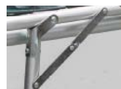
足折れ防止ストッパー