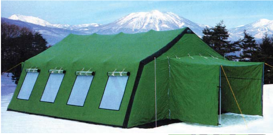
写真：米国ズムロ社製メディカルグリーン色、型式80 (写真にはオプションが含まれています)