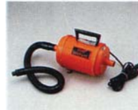
エアープンプ カナダ製 強力ポンプ