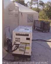
10kW generator (foreground) and HVAC