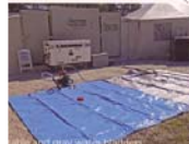
1-bay storage for 20-26 persons