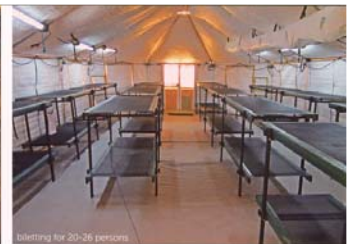
sleeping for 20-26 persons