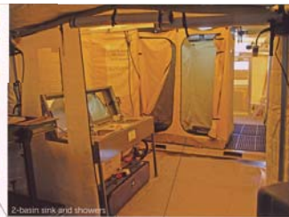
2-basin sink and shower