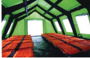
写真：型式80タイプ室内風景 マリーベッド型式MBI-8MGが20台設置

色は、メディカルグリーン・ホワイト・オレンジ・ブルー・アーミーグリーンの5色があります。ご注文の前に設計プランをお問い合わせください。(納期につきましては完全受注生産の為、ご確認をお願いします。目的に合わせた間取り・設計を行います。)