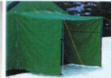
日差し 1~2カ所取付け可