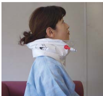
型式S11による頸部装着例

サイズ：長さ65cm×幅 22cm×厚さ2cm 重さ：150g 応用範囲：頸部、足肢、手 肢等に应用できます。