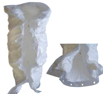
型式S91による陰圧形状記憶例

サイズ：長さ193cm×幅 66cm×厚さ6cm 重さ：2.5kg 応用範囲：成人全身、子供 全身、頭頸部、胸、腰椎 部、骨盤部等に应用でき ます。