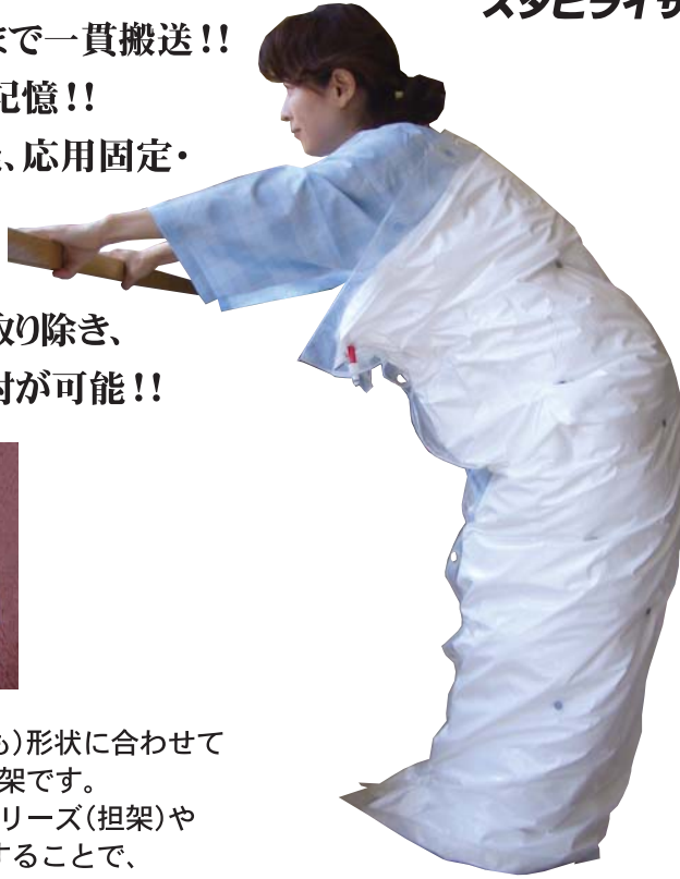
型式S91を使用した患者への装着例 (このままの体型で搬送することが可能です)

傷病者の体全体（部分的も）形状に合わせて陰圧形状できる副子兼担架です。エアーストレッチャーシリーズ（担架）やセフティ・サンドと併用することで、いろいろの搬出、搬送作業を行うことができます。