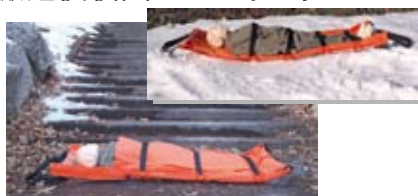
石畳・石階段待機 使用製品：ラップローバル/型式CYR-04T 雪上での待機 使用製品：プロローバル/型式CYG-06T