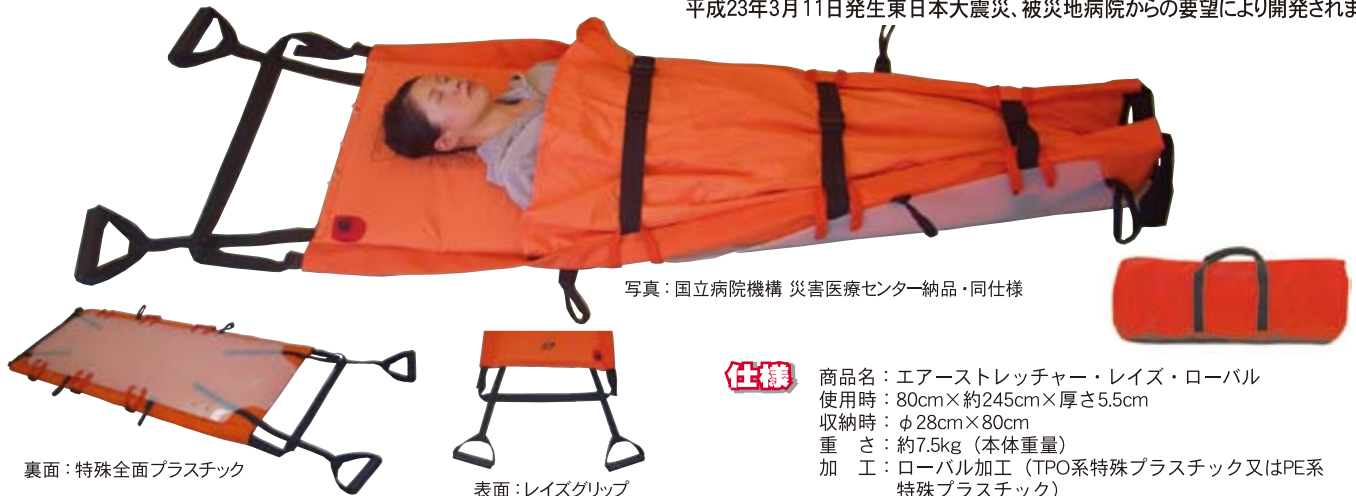
写真：国立病院機構 災害医療センター納品・同仕様

平成23年3月11日発生東日本大震災、被災地病院からの要望により開発されました。